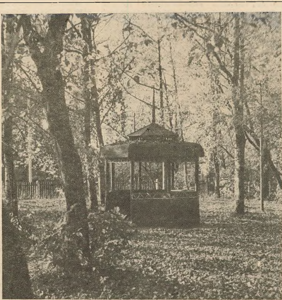
Кастрычнік на двары.

Рэдакцыя газеты «Беларускі ўніверсітэт».